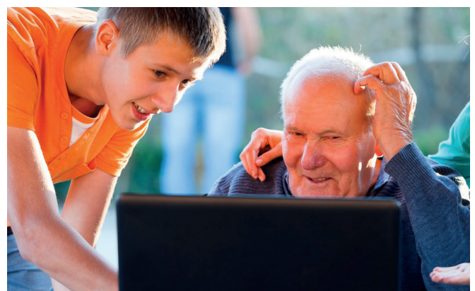
Immer wieder Neues lernen

Für das Alltagsleben bedeutet das: Tratschen Sie! Lachen Sie! Fragen Sie!